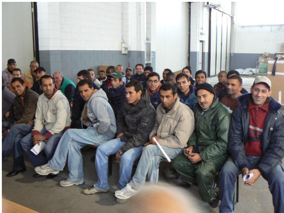
Tanti colori, una razza: umana, una classe: proletari

nostri confronti erano il più delle volte a sfondo razzista) e come cani mangiavamo in una stanza che faceva da spogliatoi e gabinetto.